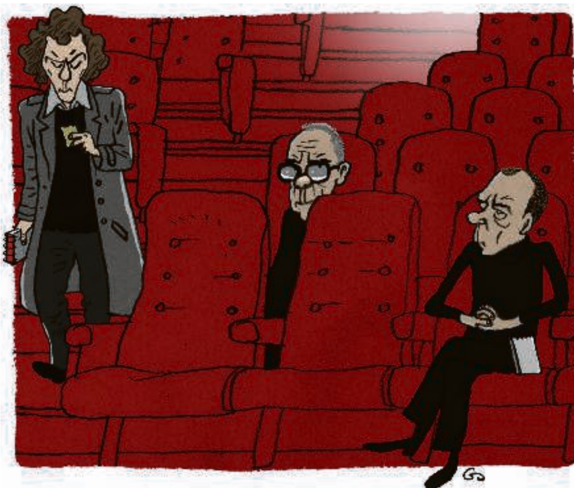
ILLUSTRATION: GITTE SKOV

Berlingske havde et fysisk arkiv. Det blev afviklet, da